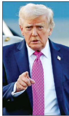
है। आज उन्होंने मुझे आश्वासन

दरअसल 15 अक्टूबर 2020 को वाइट हाउस में आयोजित किए गए एक संवाददाता सम्मेलन में अमेरिकी राष्ट्रपति ने ये दावा किया था कि प्रधानमंत्री नरेंद्र मोदी ने उन्हें आश्वासन दिया है कि भारत रूस से चल रही तेल की खरीद को बंद कर देगा। बिलकुल सही, पीएम मोदी मेरे दोस्त हैं और हमारे बीच बहुत अच्छे संबंध हैं। लेकिन मैं इस बात से खुश नहीं हूँ कि भारत रूस से तेल की खरीद कर रहा