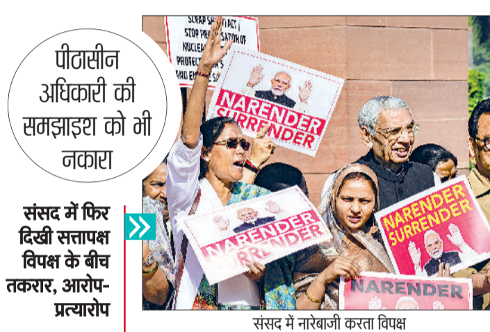
संसद में नारेबाजी करता विपक्ष

एजेंसी ► नई दिल्ली अमेरिका के साथ व्यापार समझौते को लेकर विपक्ष के हंगामे के कारण गुरुवार को लोकसभा की कार्यवाही बारह बजे तक के लिए स्थगित कर दी गई। सदन की कार्यवाही शुरू होते ही पीठासीन अधिकारी कृष्णा प्रसाद तेनेटी ने प्रश्नकाल के लिए एक सदस्य का नाम पुकारा तभी विपक्षी दलों के सदस्य हंगामा और नारेबाजी करने लगे और सदन के बीचोंबीच आ गए। पीठासीन अधिकारी ने कहा कि हंगामे के बीच प्रश्नकाल चलाने की कोशिश की और बिजली राज्यमंत्री श्रीपद येसो नाईक ने एक पूरक प्रश्न का जवाब देते हुए कहा कि सरकार की नीतियों के कारण बिजली के क्षेत्र में देश संभन हुआ है।