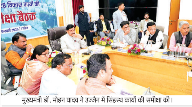
मुख्यमंत्री डॉ. मोहन यादव ने उज्जैन में सिंहस्थ कार्यों की समीक्षा की।