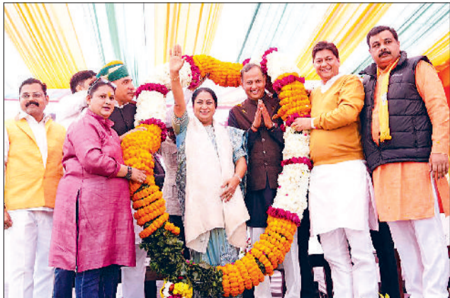
हरिभूमि न्यूज ▶▶ नई दिल्ली

दिल्ली सरकार ने प्रधानमंत्री नरेंद्र मोदी के 'सबका साथ, सबका विकास, सबका विश्वास और सबका प्रयास' के मूल मंत्र पर चलते हुए गुरुवार को सरकार ने