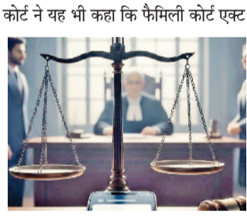
कोर्ट ने यह भी कहा कि फैमिली कोर्ट एक्ट की धारा 14 फैमिली कोर्ट को यह विशेष अधिकार देती है कि वह वैवाहिक विवाद के प्रभावी निपटारे के लिए किसी भी प्रासंगिक दस्तावेज या जानकारी को सबूत के रूप में स्वीकार कर सकती है, भले ही वह सामान्य रूप से एविडेंस एक्ट के तहत मान्य न हो। सुप्रीम कोर्ट के फैसलों का हवाला देते हुए हाई कोर्ट ने स्पष्ट किया कि यदि कोई सबूत मामले से जुड़ा और जरूरी है, तो उसे किस तरीके से हासिल किया गया है, यह उतना महत्वपूर्ण नहीं है। हाई कोर्ट ने कहा कि अदालतों को दोनों पक्षों के हितों के बीच संतुलन बनाना होता है। पति को अपनी बात साबित करने के लिए जरूरी और प्रासंगिक सबूत पेश करने का अवसर मिलना चाहिए, ताकि मामले का निष्पक्ष और सही फैसले हो सके।