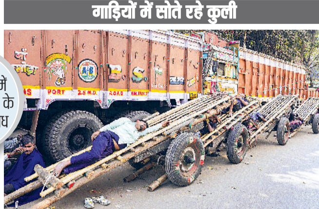
गाड़ियों में सोते रहे कुली

एजेंसी ► कोलकाता केंद्रीय ट्रेड यूनियनों के संयुक्त मंच द्वारा चार श्रम संहिताओं को निरस्त करने और कई सरकारी नीतियों को वापस लेने की मांग को लेकर बुलाई गई राष्ट्रव्यापी हड़ताल के बीच कोलकाता में कुली अपनी गाड़ियों पर सोते रहे।