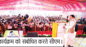
कार्यक्रम को संबोधित करते सीएम।

विशेष प्रतिनिधि, भोपाल मुख्यमंत्री डॉ. मोहन यादव ने कहा है कि वन मेलें प्रदेश की समृद्ध जैविक और वानस्पतिक विविधताओं को प्रदर्शित करने का सशक्त माध्यम हैं। इनके जरिए हमारे जनजातीय भाई-बहनों को वनोत्पाद और कृषि शिल्प विक्रय करने का मौका मिलता है। उन्होंने कहा कि 'श्री महाकाल वन मेलें' की आज से शुरुआत हो गई है। मेलें में प्रदर्शित जड़ी-बूटियां तथा विभिन्न प्रकार के शुद्ध एवं सुरक्षित अकाष्ठिय लघु वनोत्पाद आयुर्वेदिक और प्राकृतिक चिकित्सा पद्धतियों से रोगोंपाद में बेहद उपयोगी होते हैं। वनोत्पादों हर रोग के इलाज में कारगर साबित हो रही हैं। इनसे असंभव रोग का इलाज भी संभव हो रहा है। डॉ. यादव ने कहा कि प्रधानमंत्री नरेन्द्र मोदी के मार्गदर्शन में केंद्रीय बजट-2026 में परस की तर्ज पर देश में तीन नए अखिल भारतीय आयुर्वेद संस्थान खोलने की घोषणा की गई है।